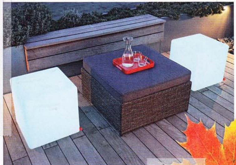
Alle Anweisungen auf Seite 50

„Cube“ ist ein echter Könnler: Der Sitz-Würfel wechselt die Farbe und leuchtet bis zu 14 Std. per Akku! H 41 cm, um 229 € (Moree)